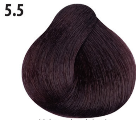
5.5 Licht mahoniebruin Açık kahve mahagoni Châtain clair acajou Light mahogany brown HELLBRAUN MAHAGONI