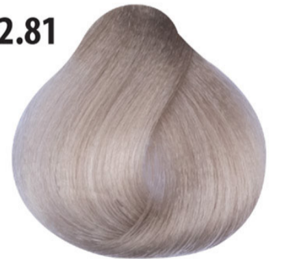
12.81 Extra platina asblond pearl Extra platin inci küllü sarı Perle blonde extra platine cendré Extra platinum blonde pearl ash EXTRA PLATINBLOND PERL ASCH