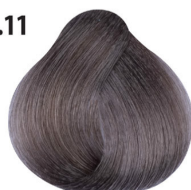
9.11 Intens as zeer lichtblond Yoğun küllü sarı Blond très clair cendré intense Intense ash very light blond LICHTBLOND ASCH INTENSIV