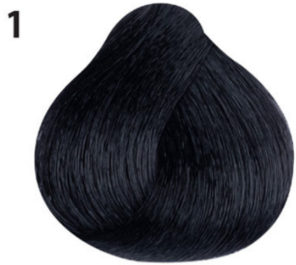
1 Zwart Siyah Noir Black SCHWARZ