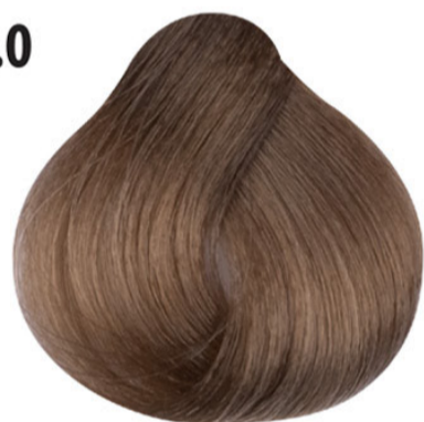
9.0 Intense heel licht blond Yoğun sarı Blond très clair intense Intense very light blond LICHTBLOND INTENSIV