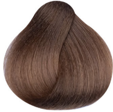
7 Blond Orta kumral Blond Blond MITTELBLOND