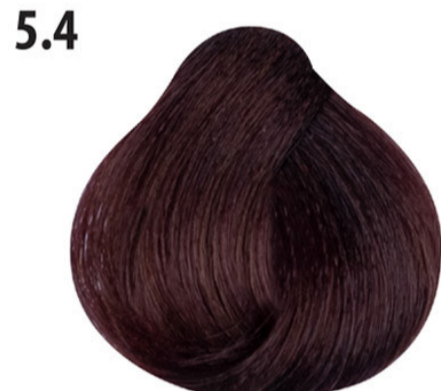
5.4 Licht koperbruin Açık kahve bakır Châtain clair cuivré Light copper brown HELLBRAUN KUPFER