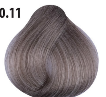
10.11 Intense as lichtste blond Yoğun küllü açık sarı Blond clair clair cendré intense Intense ash lightest blond HELL LICHTBLOND ASCH INTENSIV