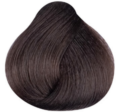
5 Lichtbruin Açık kahve Châtain clair Light brown HELLBRAUN