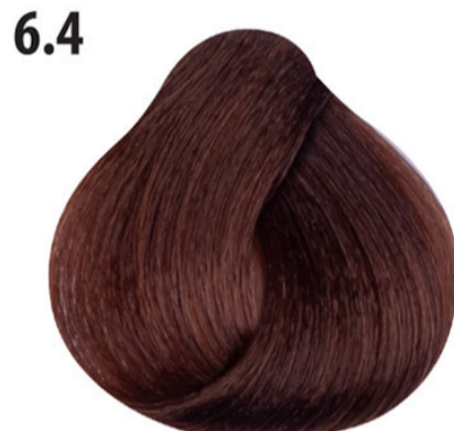
6.4 Donker koperblond Koyu kumral bakır Blond foncé cuivré Dark copper blond DUNKELBLOND KUPFER