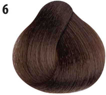
6 Donker blond Koyu kumral Blond foncé Dark blond DUNKELBLOND