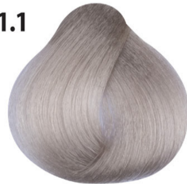
11.1 Platina asblond Küllü platin sarı Blond platine cendré Ash platinum blond PLATINBLOND ASCH