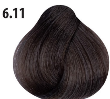
6.11 Intens as donkerblond Yoğun küllü koyu kumral Blond foncé cendré intense Intense ash dark blond DUNKELBLOND ASCH INTENSIV