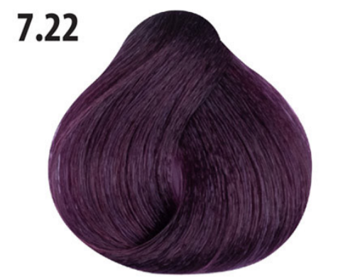
7.22 Intens irisée blond Orta kumral yoğun lila Blond irisée intense Intense irisée blond MITTELBLOND VIOLETT INTENSIV