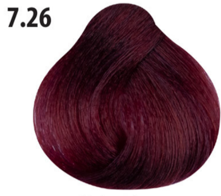
7.26 Rode malva Orta kumral lila kızıl Mauve rouge Red mallow MITTELBLOND VIOLETT ROT