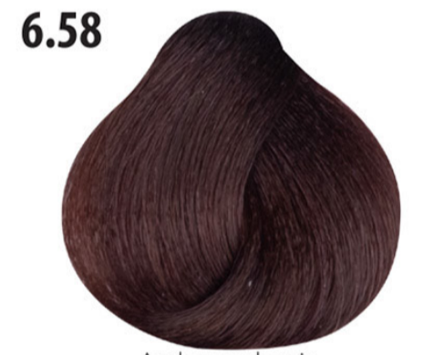
6.58 Amber mahonie Koyu kumral mahagoni amber Acajou ambre Amber mahogany DUNKELBLOND MAHAGONI AMBER