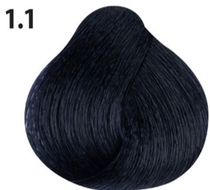
1.1 Blauw zwart Mavi siyah Noir bleu Blue black BLAUSCHWARZ