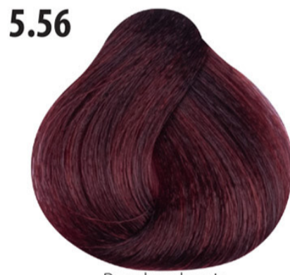
5.56 Rood mahonie Açık kahve mahagoni kızıl Acajou rouge Red mahogany HELLBRAUN MAHAGONI ROT