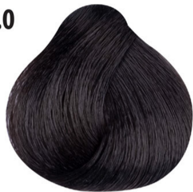
4.0 Intens bruin Orta Yoğun Kahve Châtain intense Intense brown MITTELBRAUN INTENSIV