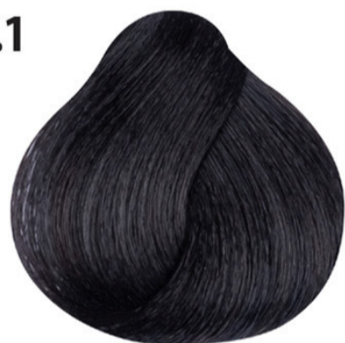
4.1 Asbruin Küllü orta kahve Châtain cendré Ash brown MITTELBRAUN ASCH