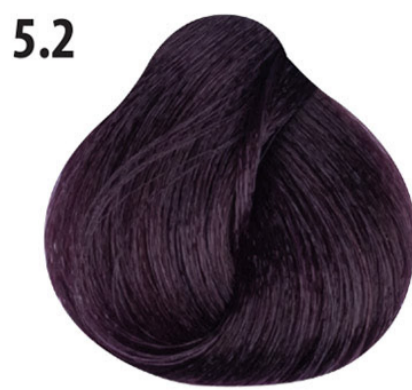
5.2 Licht irisée bruin Açık kahve lila Châtain clair irisée Light irisée brown HELLBRAUN VIOLETT