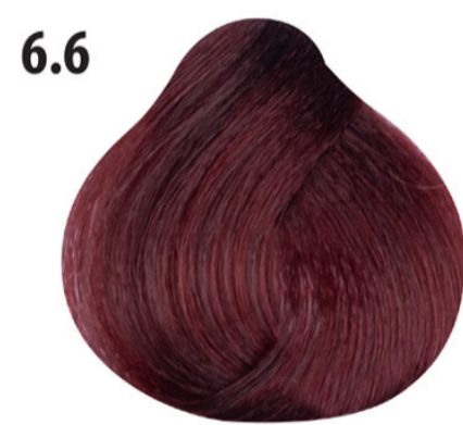
6.6 Donkerrode blond Koyu kumral kızıl Blond foncé rouge Dark red blond DUNKELBLOND ROT