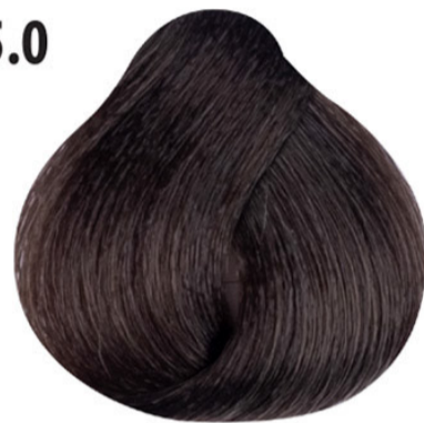
5.0 Intens lichtbruin Açık yoğun kahve Châtain clair intense Intense light brown HELLBRAUN INTENSIV