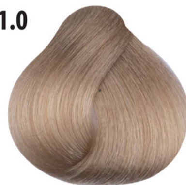
11.0 Platina blond intensief Platin Yoğun Sarı Intensif blond platine Intense platinum blond PLATINBLOND INTENSIV