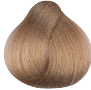
9 Heel licht blond Sarı Blond très clair Very light blond LICHTBLOND