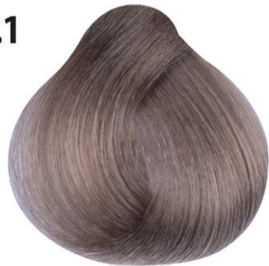
9.1 Heel licht as blond Küllü sarı Blond très clair cendré Very light ash blond LICHTBLOND ASCH