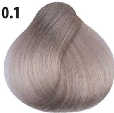
10.1 Lichtste asblond Küllü açık sarı Blond clair clair cendré Lightest ash blond HELL LICHTBLOND ASCH