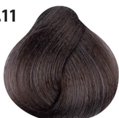
7.11 Intens as blond Yoğun küllü orta kumral Blond cendré intense Intense ash blond MITTELBLOND ASCH INTENSIV