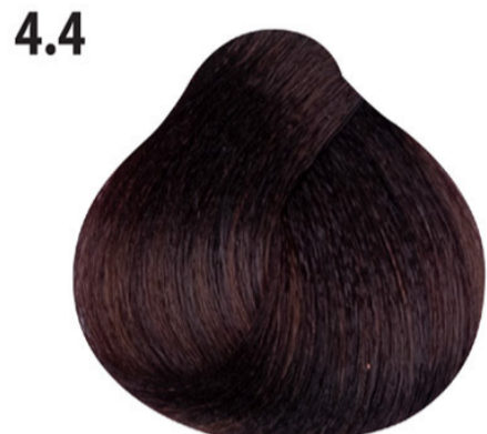
4.4 Koperbruin Orta kave bakır Châtain cuivré Copper brown MITTELBRAUN KUPFER