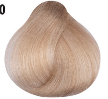
10 Lichtste platina blond Açık sarı Blond clair clair platine Lightest blond HELL LICHTBLOND