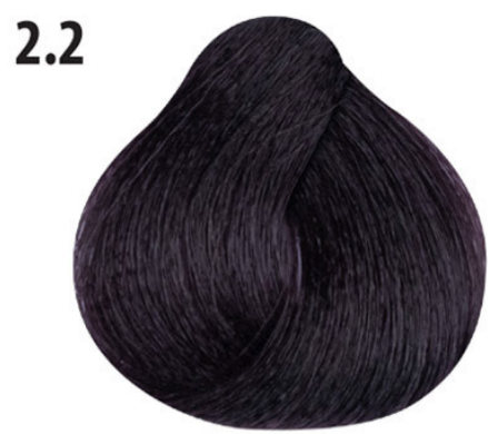
2.2 Diepe irisée Koyu lila Irisée profond Deep irisée TIEF VIOLETT