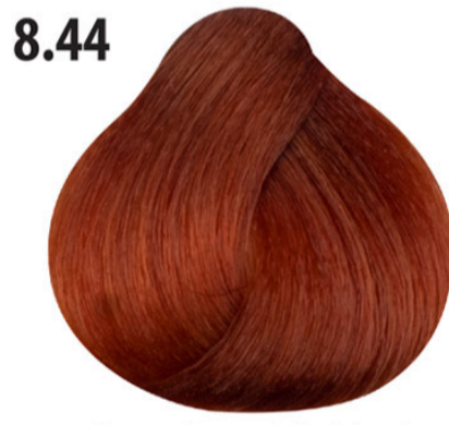
8.44 Intens koper licht blond Açık kumral yoğun bakır Blond clair cuivré intense Intense copper light blond HELLBLOND KUPFER INTENSIV