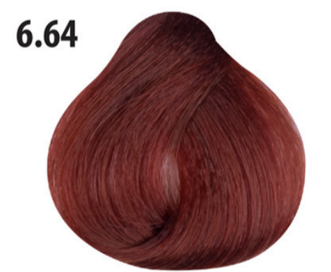
6.64 Koper donker rood blond Koyu kumral kızıl bakır Blond foncé rouge cuivré Copper dark red blond DUNKELBLOND ROT KUPFER