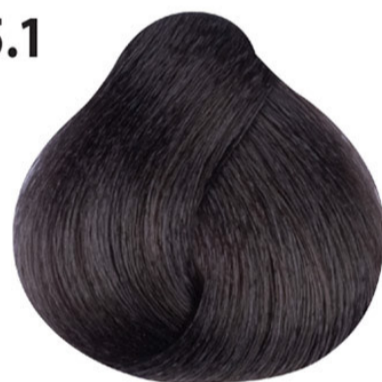
5.1 Licht as bruin Küllü açık kahve Châtain clair cendré Light ash brown HELLBRAUN ASCH