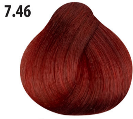
7.46 Rood koperblond Orta kumral bakır kızıl Blond cuivré rouge Red copper blond MITTELBLOND KUPFER ROT