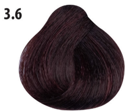
3.6 Rood donkerbruin Koyu kahve kızıl Châtain foncé rouge Red dark brown DUNKELBRAUN ROT