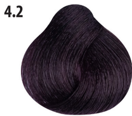
4.2 Irisée bruin Orta kahve lila Châtain irisée Irisée brown MITTELBRAUN VIOLETT