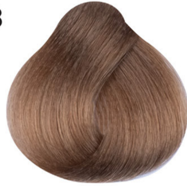
8 Lichtblond Açık kumral Blond clair Light blond HELLBLOND