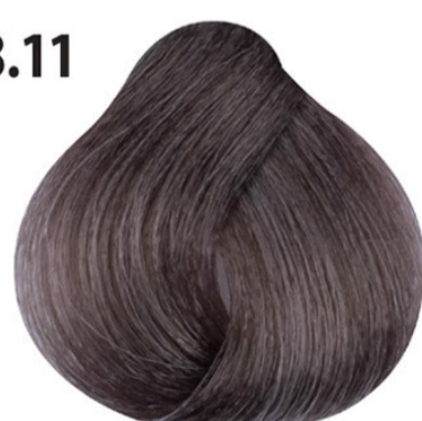
8.11 Intens as lichtblond Yoğun küllü açık kumral Blond clair cendré intense Intense ash light blond HELLBLOND ASCH INTENSIV