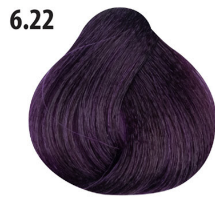
6.22 Intense kaasjeskruid Koyu kumral yoğun lila Mauve intense Intense mallow DUNKELBLOND VIOLETT INTENSIV