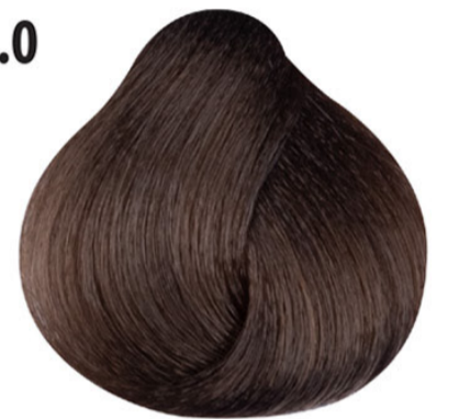
7.0 Rubio intenso Intens blond Orta yoğun kumral Blonde intense Intense blond MITTELBLOND INTENSIV