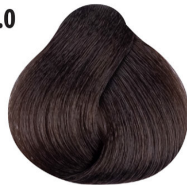
6.0 Intens donker blond Koyu yoğun kumral Blond foncé intense Intense dark blond DUNKELBLOND INTENSIV