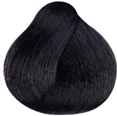
2 Zwartbruin Siyah kahve Noir marron Black-brown SCHWARZBRAUN