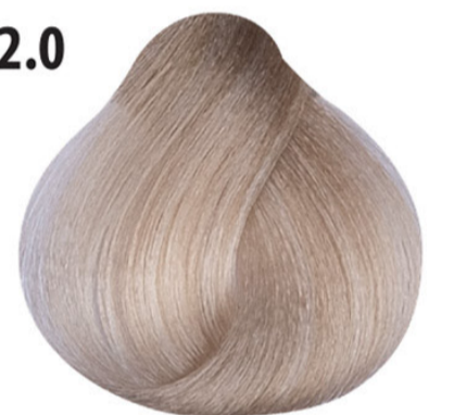
12.0 Intens extra platina blond Extra platin yoğun sarı Intensif extra blond platine Intense extra platinum blond EXTRA PLATINBLOND INTENSIV