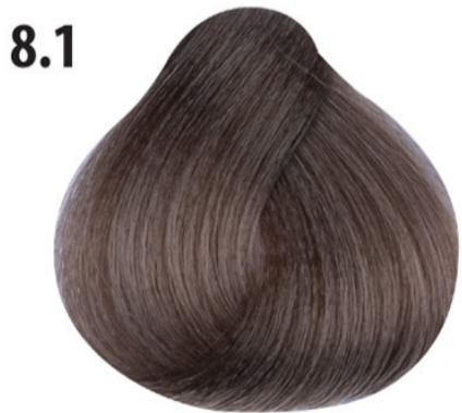
8.1 Licht as blond Küllü açık kumral Blond clair cendré Light ash blond HELLBLOND ASCH