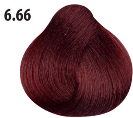
6.66 Intens donker rood blond Koyu kumral yoğun bakır Blond foncé rouge intense Intense dark red blond DUNKELBLOND ROT INTENSIV