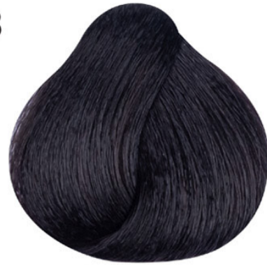
3 Donker bruin Koyu kahve Châtain foncé Dark brown DUNKELBRAUN