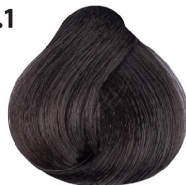
6.1 Dark as blond Küllü koyu kumral Blond foncé cendré Dark ash blond DUNKELBLOND ASCH