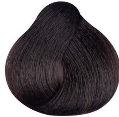
4 Bruin Orta kahve Châtain Brown MITTELBRAUN