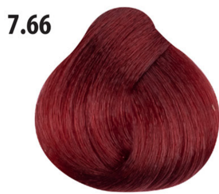
7.66 Intens rood blond Orta kumral yoğun bakır Blond rouge intense Intense red blond MITTELBLOND ROT INTENSIV