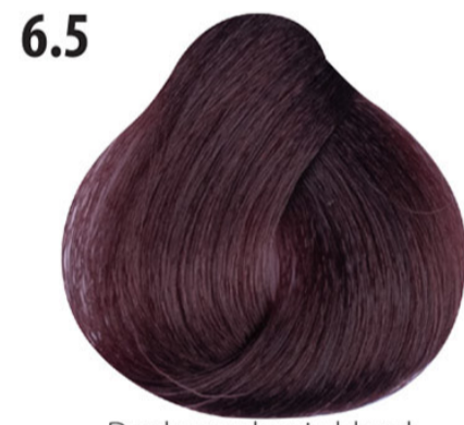
6.5 Donker mahonie blond Koyu kumral mahagoni Blond foncé acajou Dark mahogany blond DUNKELBLOND MAHAGONI