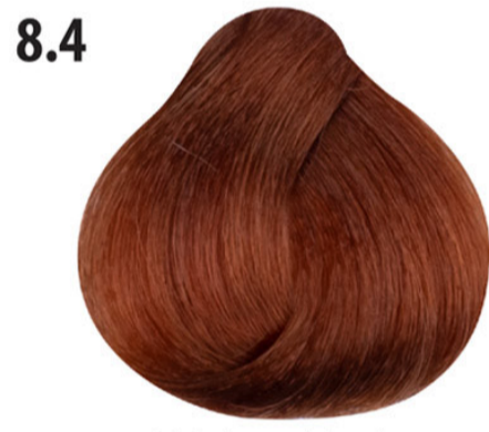
8.4 Licht koperblond Açık kumral bakır Blond clair cuivré Light copper blond HELLBLOND KUPFER