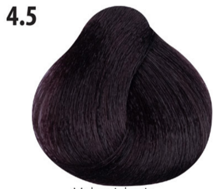
4.5 Mahoniebruin Orta kahve mahagoni Châtain acajou Mahogany brown MITTELBRAUN MAHAGONI