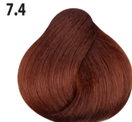
7.4 Koperblond Orta kumral bakır Blond cuivré Copper blond MITTELBLOND KUPFER