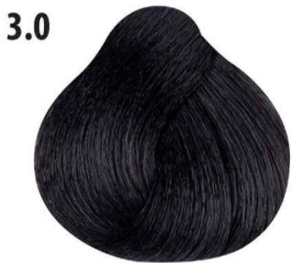
3.0 Intens donkerbruin Koyu Yoğun Kahve Châtain foncéintense Intense dark brown DUNKELBRAUN INTENSIV