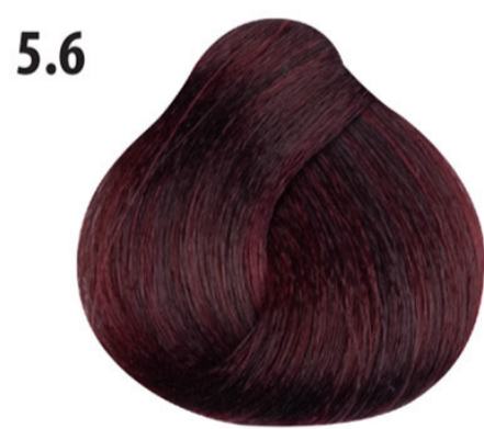
5.6 Licht rood bruin Açık kahve kızıl Châtain clair rouge Light red brown HELLBRAUN ROT