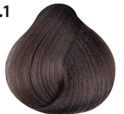
7.1 As blond Küllü orta kumral Blond cendré Ash blond MITTELBLOND ASCH