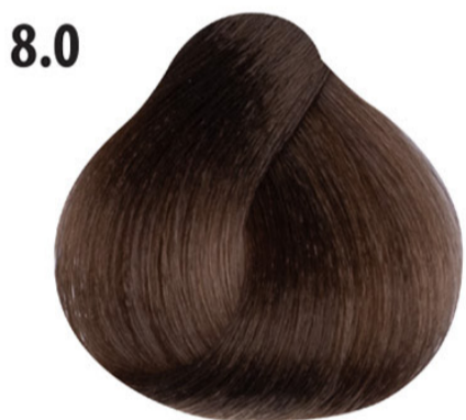
8.0 Intens licht blond Açık yoğun kumral Blond clair intense Intense light blond HELLBLOND INTENSIV