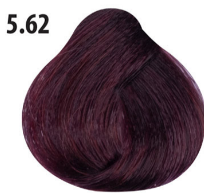
5.62 Irisée licht roodbruin Açık kahve kızıl lila Châtain clair rouge irisée Irisée light red brown HELLBRAUN ROT VIOLETT