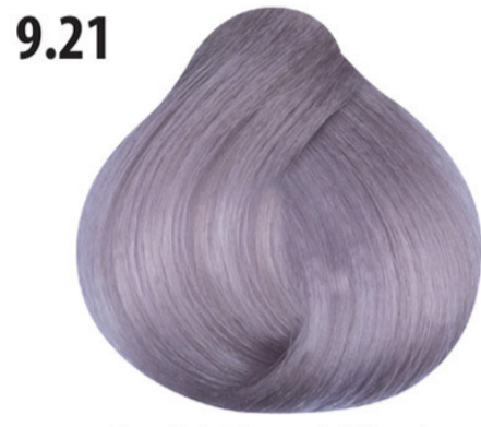
9.21 Zeer licht lavendelblond Sarı lila lavanta Blond très clair lavender Very light lavender blond LICHTBLOND LAVENDEL