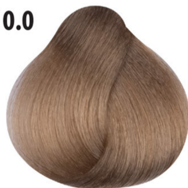
10.0 Intens lichtste platina blond Açık yoğun sarı Blond Clair Clair Intensif Intense lightest blond HELL LICHTBLOND INTENSIV