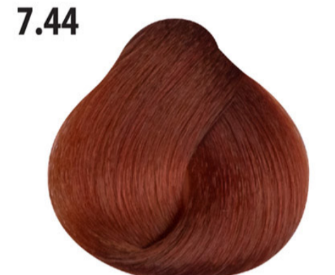
7.44 Intense koperblond Orta kumral yoğun bakır Blond cuivré intense Intense copper blond MITTELBLOND KUPFER INTENSIV